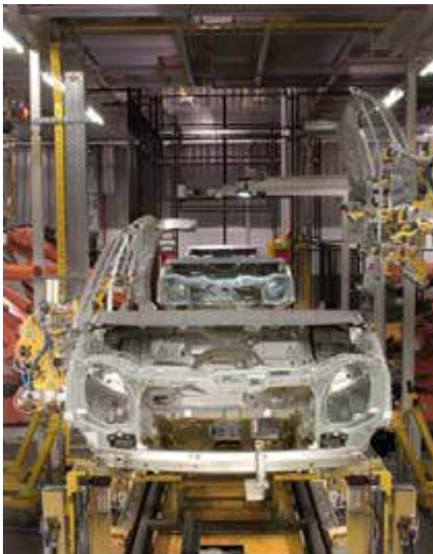
La automoción en Aragón supone entre el 3,5 y el 4 por ciento del PIB. €€

Fuente: Base de datos de comercio exterior de las Cámaras de Comercio y la Agencia Tributaria. (*) De ene-oct (últimos datos disponibles) elEconomista